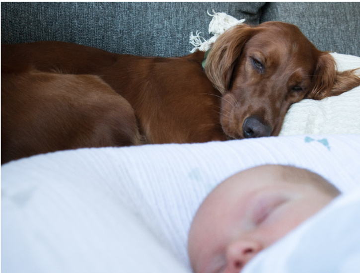
Pouppy die over je waakt